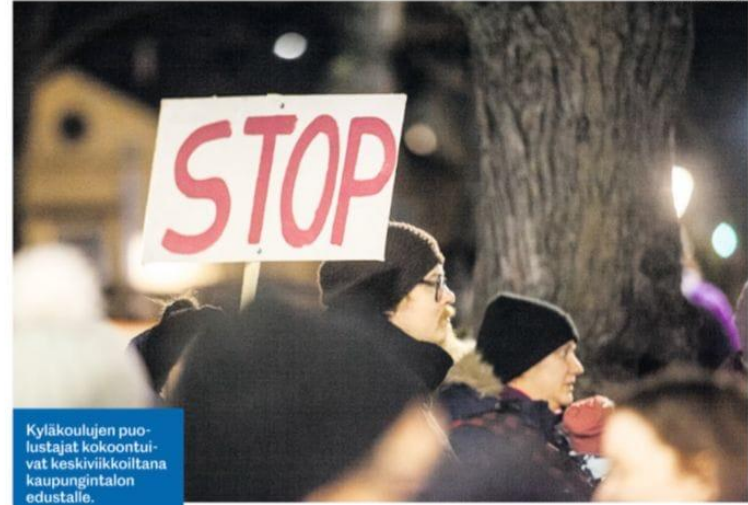
Kyläkoulujen puolestajajat kokoontuivat keskiiviikkoiltana kaupungintalon edustalle.

– Kotiinpäin vetäminen ei tunnusta sijoitukseen enää kannattavan. Nestekin romahti